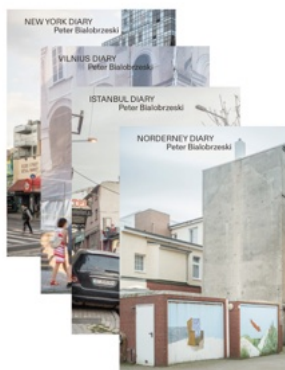
Peter Bialobrzeski City Diaries

19 × 24,5 cm, 172 S. pp., 42 Abb. ill., davon 33 Porträts, with 33 portraits