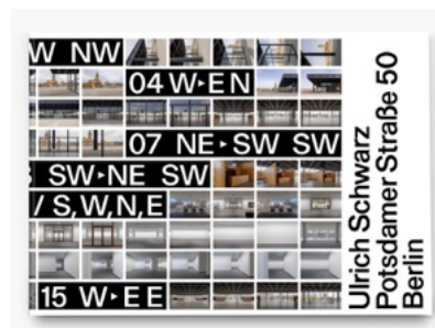
Ulrich Schwarz Potsdamer Straße 50 Berlin

30,5 × 22 cm 228 S. pp., 103 Abb. ill. Konzept Concept: Ulrich Schwarz Text: Ulf Erdmann Ziegler Zitat quote: Thomas Bernhard